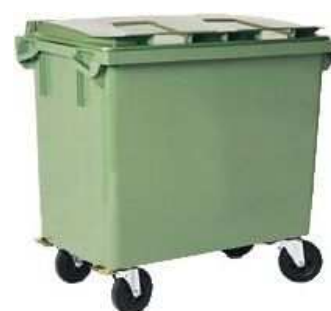
660 liter Kärlet har fyra hjul.