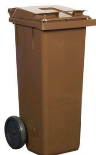
140 liter Endast avsett för papperspåsar med matavfall.