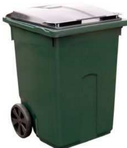
370 liter Kärlet har fyra hjul.