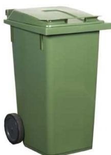
240 liter Kärlet har tre gångjärn för locket.