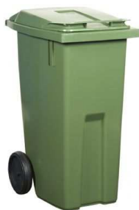
190 liter Kärlet har två gångjärn för locket.